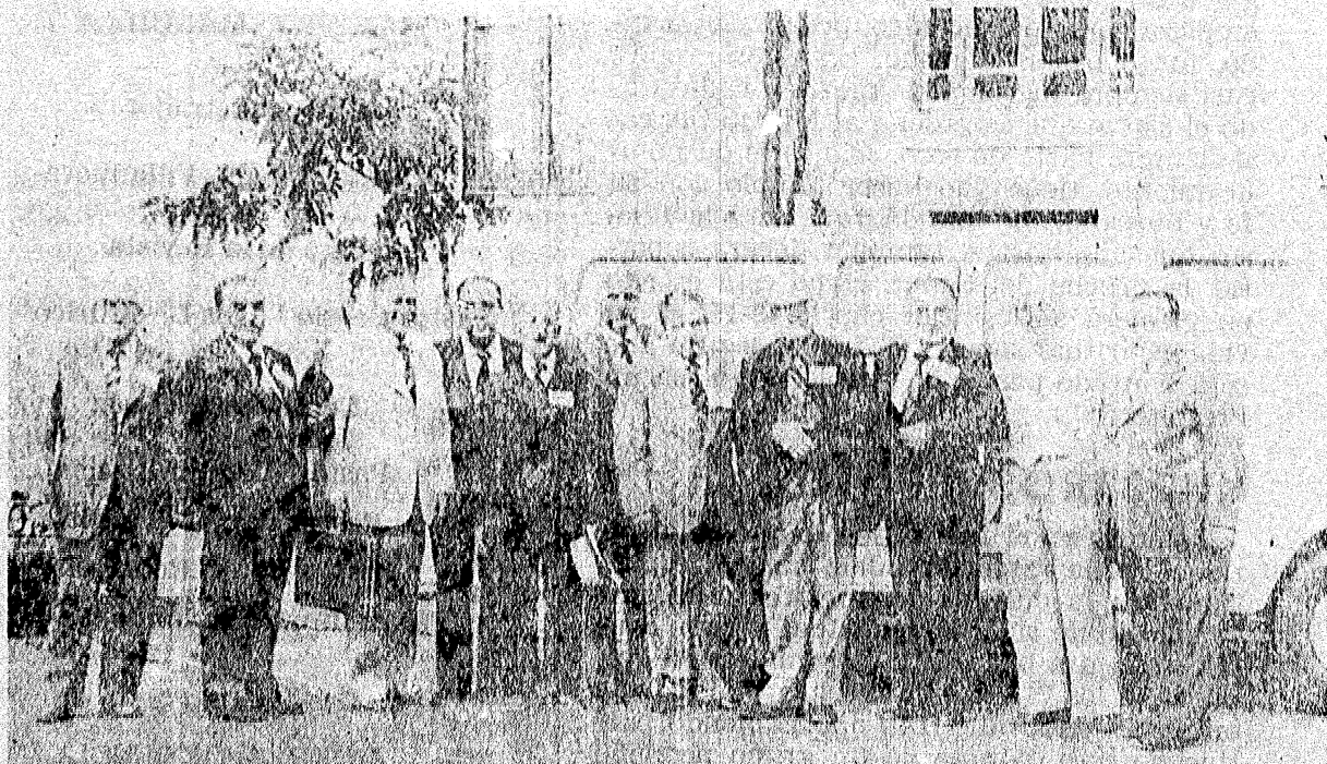
En la foto aparece el Directorio de la 71 a Conferencia Anual de Pastores, realizada recientemente en la ciudad de Talca.

NUMERO 3 — REVISTA BIMESTRAL — ENERO - FEBRERO DE 1980