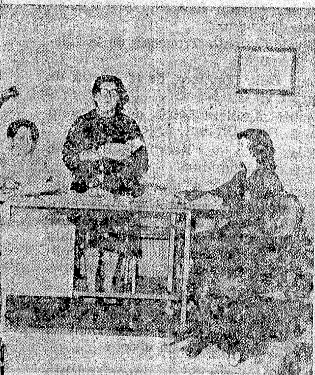
Reunión de Pastorales que se realizó en Talca.

biado el nombre de nuestra revista Chile Pentecostal, por "La Voz Pentecostal". También se celebraron Estudios Bíblicos en cuatro etapas de norte a sur del país, siendo de gran bendición a todo el Pastorado. Nuestro Obispo Presidente informa que en Brasil, Bello Horizonte, una Misión Metodista Pentecostal Wesleyana desea ingresar a nuestra misión; la respuesta en estudio. Nuestro Obispo hace ver al Pastorado que