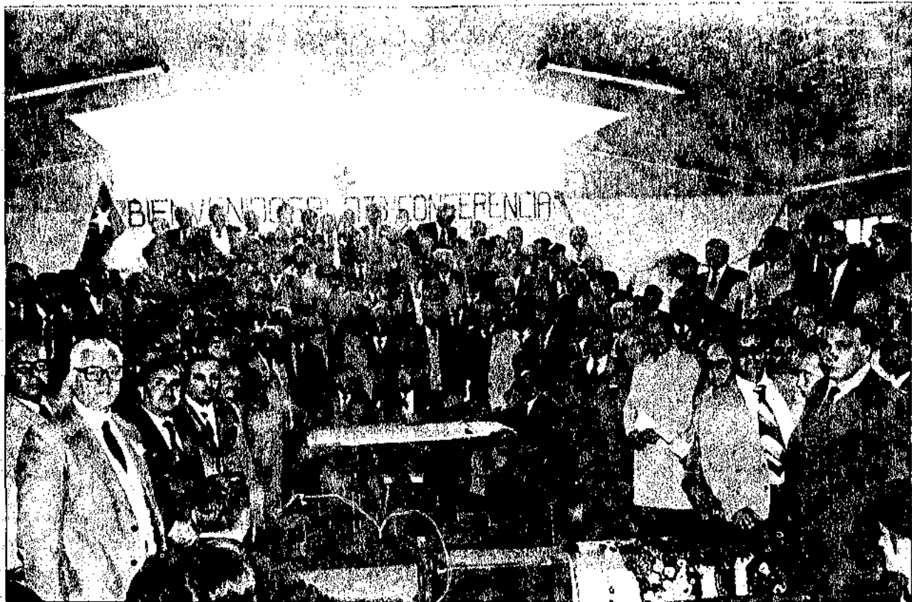
Pastores y Pastoras en la Conferencia Internacional realizada en la ciudad de Puerto Montt.