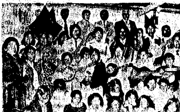
AREQUIPA - PERU