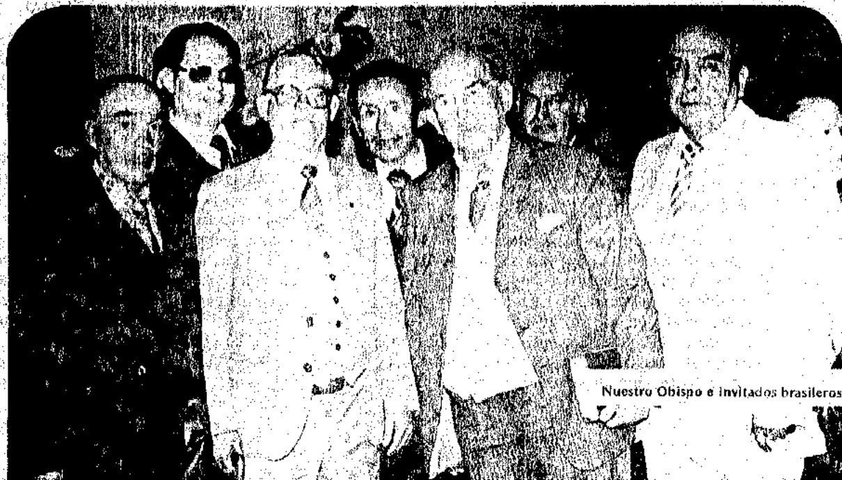
Nuestro Obispo e invitados brasileiros

Corresponsal de la Conferencia y Comisión de Redacción de "La Voz Pentecostal".