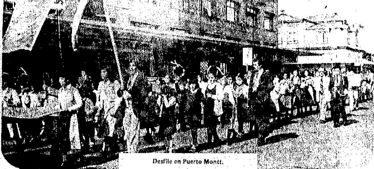
Desfile en Puerto Montt.

sonas que, con su presencia, estaban dando testimonio de la obra de salvación realizada por medio del Evangelio de Nuestro Señor Jesucristo.