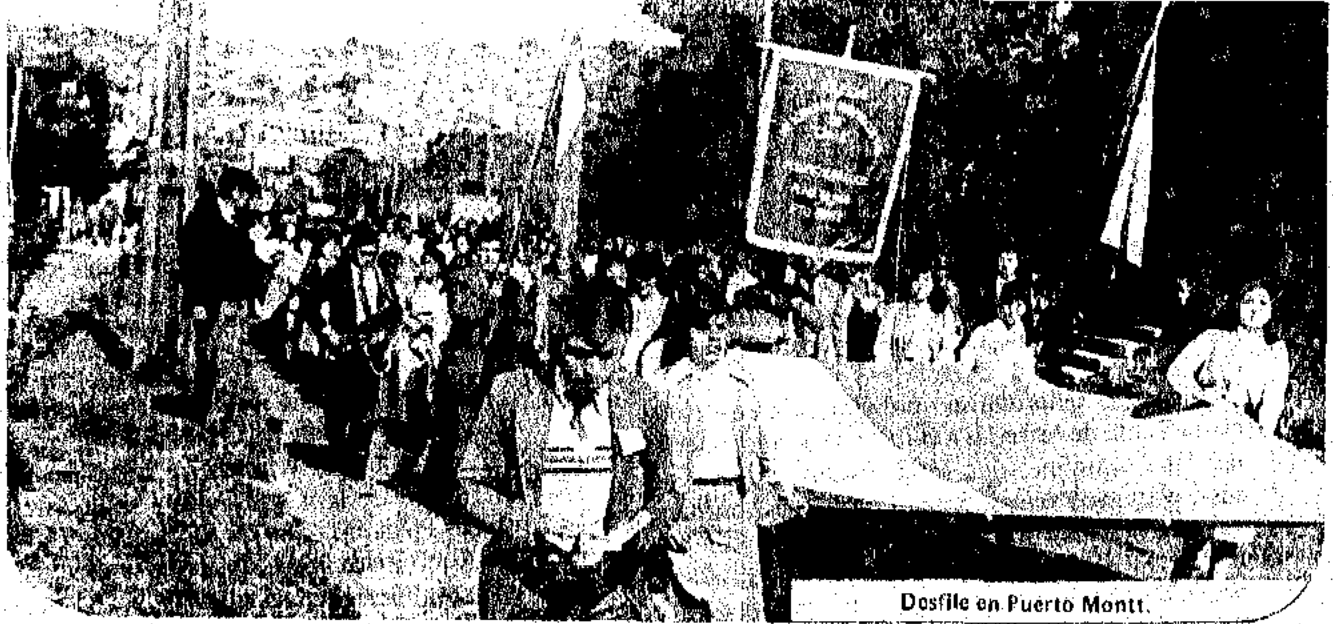
Desfile en Puerto Montt.

La ciudad posee actualmente una población aproximada de 100.000 habitantes. Fue fundada en virtud de decreto dictado por el Presidente don Manuel Montt, de fecha 12 de febrero de 1853. Está circundada por hermosas colinas desde cuyas cimas el visitante puede contemplar el maravilloso panorama que deja a la vista el seno de Reloncaví y las islas adyacentes, por el sur, y por el oriente, los majestuosos volcanes, cubiertos en sus cumbres por las nieves eternas.