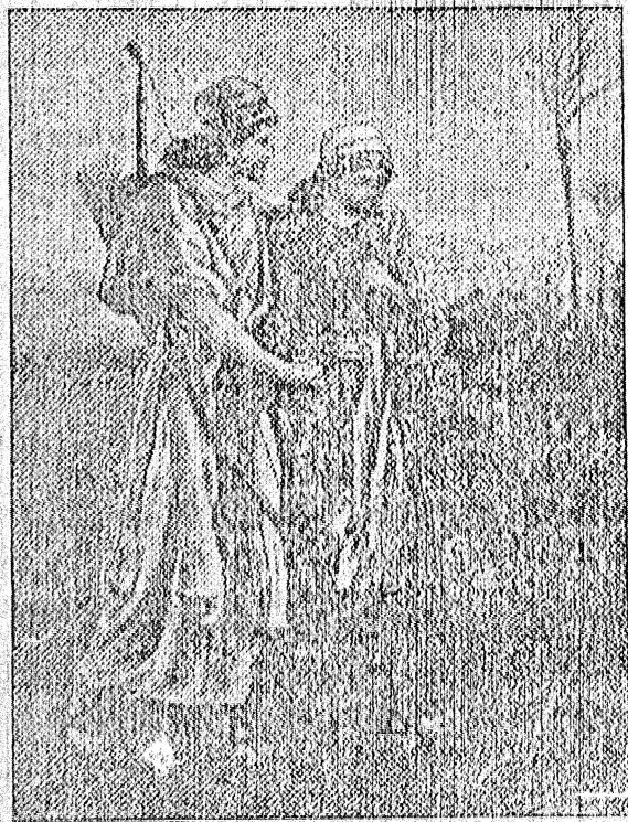
La amistad de David con Jonathán

He aquí yo vengo en breve. (Rev. 22: 12) dice Jesús.